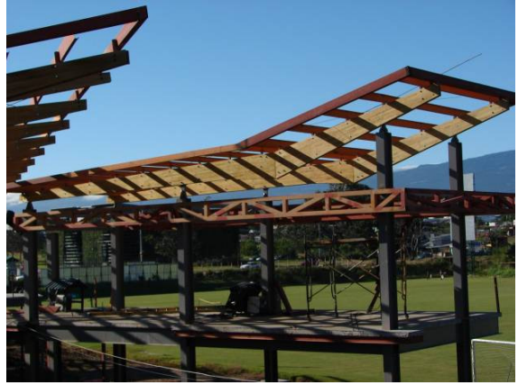
Vista parcial de la instalaciones de proyecto Goal de la Fedefutbol en San Rafael de Alajuela. Observe las vigas de madera de 14 mt. de longitud.

La presentación magistral contiene gran cantidad de ejemplos a nivel nacional y mundial de estructuras notables de madera.