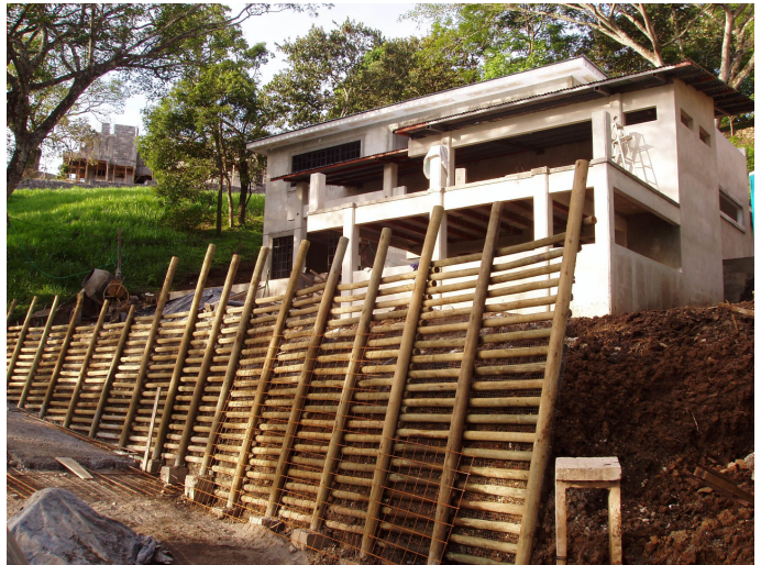
Fig. 3 Muro de retención de suelos en Urbanización Vista Real en Santa Ana, Costa Rica.