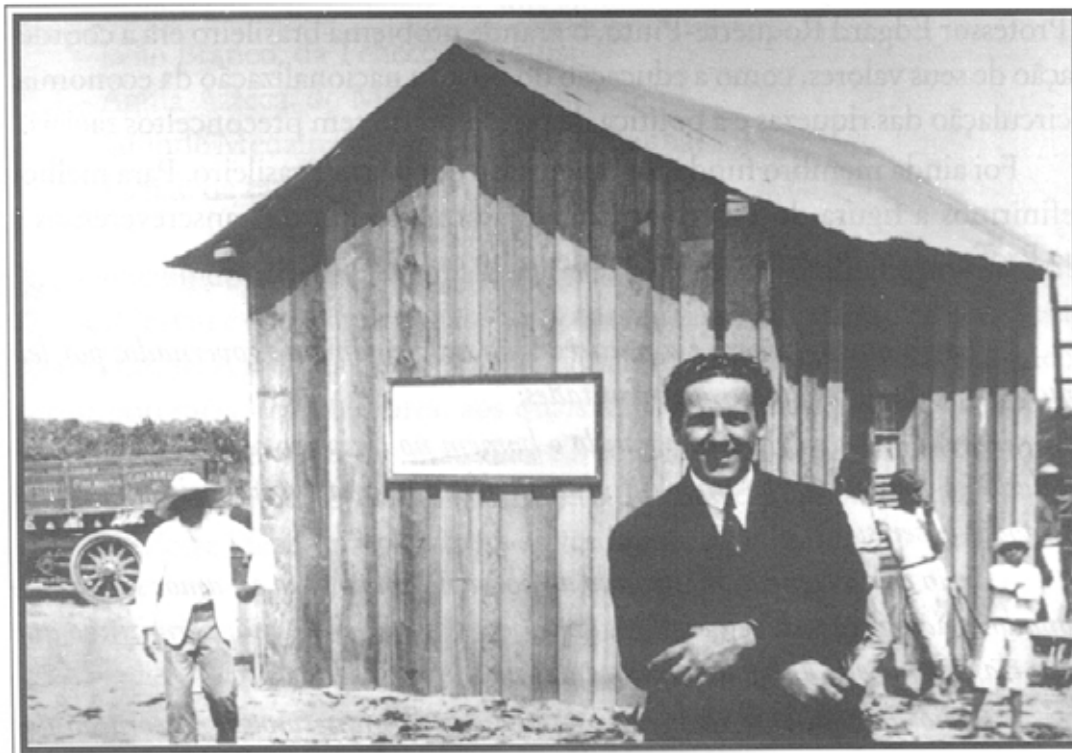
Roquette- Pinto y la Rádio Sociedade