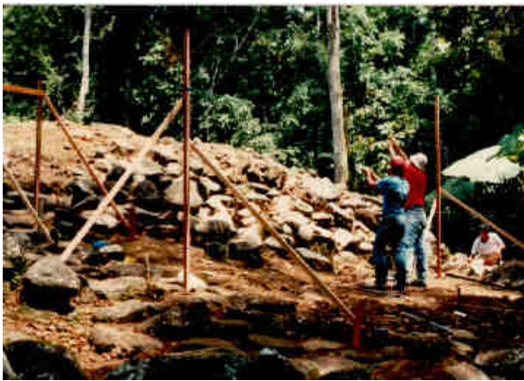
Montículo rectangular antes de restauración

Del total del área excavada se realizaron trabajos de restauración en un 75% del total del área, logrando reconstruir los montículos rectangulares, la calzada Caragra para una longitud de 170 metros de largo y 6 metros de ancho, las gradas y una calzada de 1x16 metros entre los montículos rectangulares, para un total aproximada de 2000 m 2 .