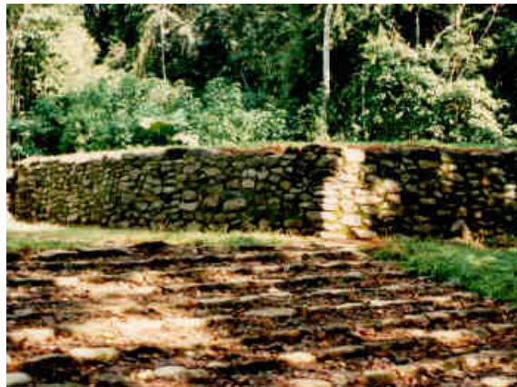
Montículo rectangular luego de restauración

Entre mayo 2013 y marzo 2014 se realizó la excavación y restauración del área faltante de la calzada Caragra, los montículos en forma de "8", la plaza mayor, la acera perimetral y la gradería junto al muro del montículo 28.